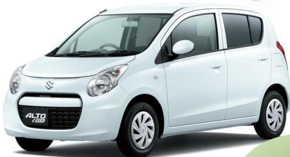
写真 新色:リーフホワイト グレード:エコーS 車両本体価格 ¥995,000